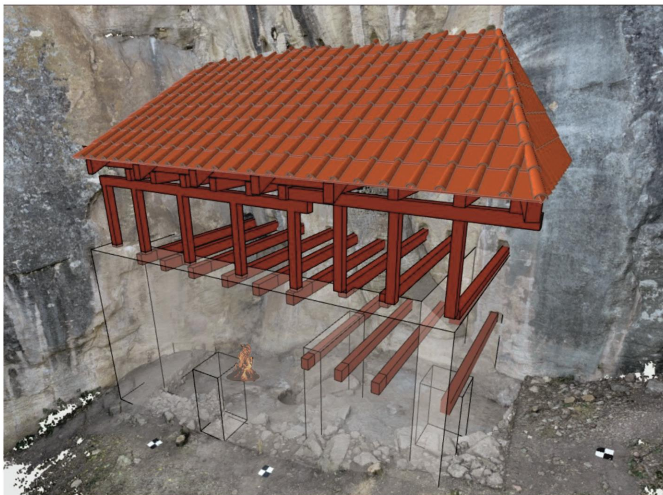
Идейна възстановка на храмовата сграда